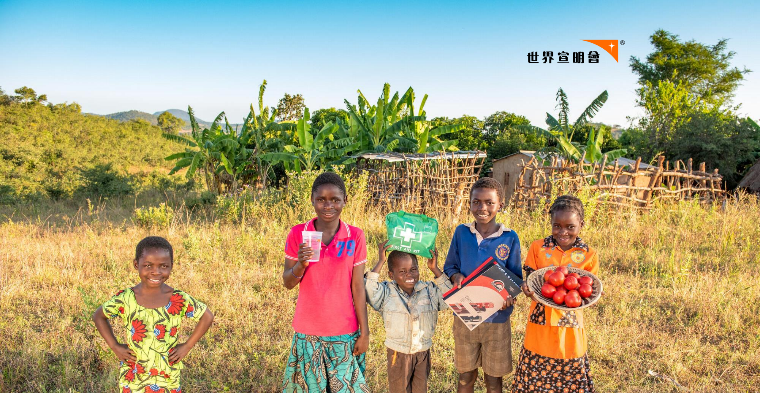
德比和她的好朋友，在村內相親相愛，並享用到宣明會的工作成果。