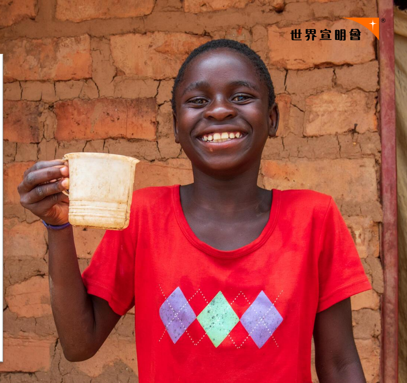
宣明會在村內興建的水喉，令德比和大姐姐可以享用清潔食水。