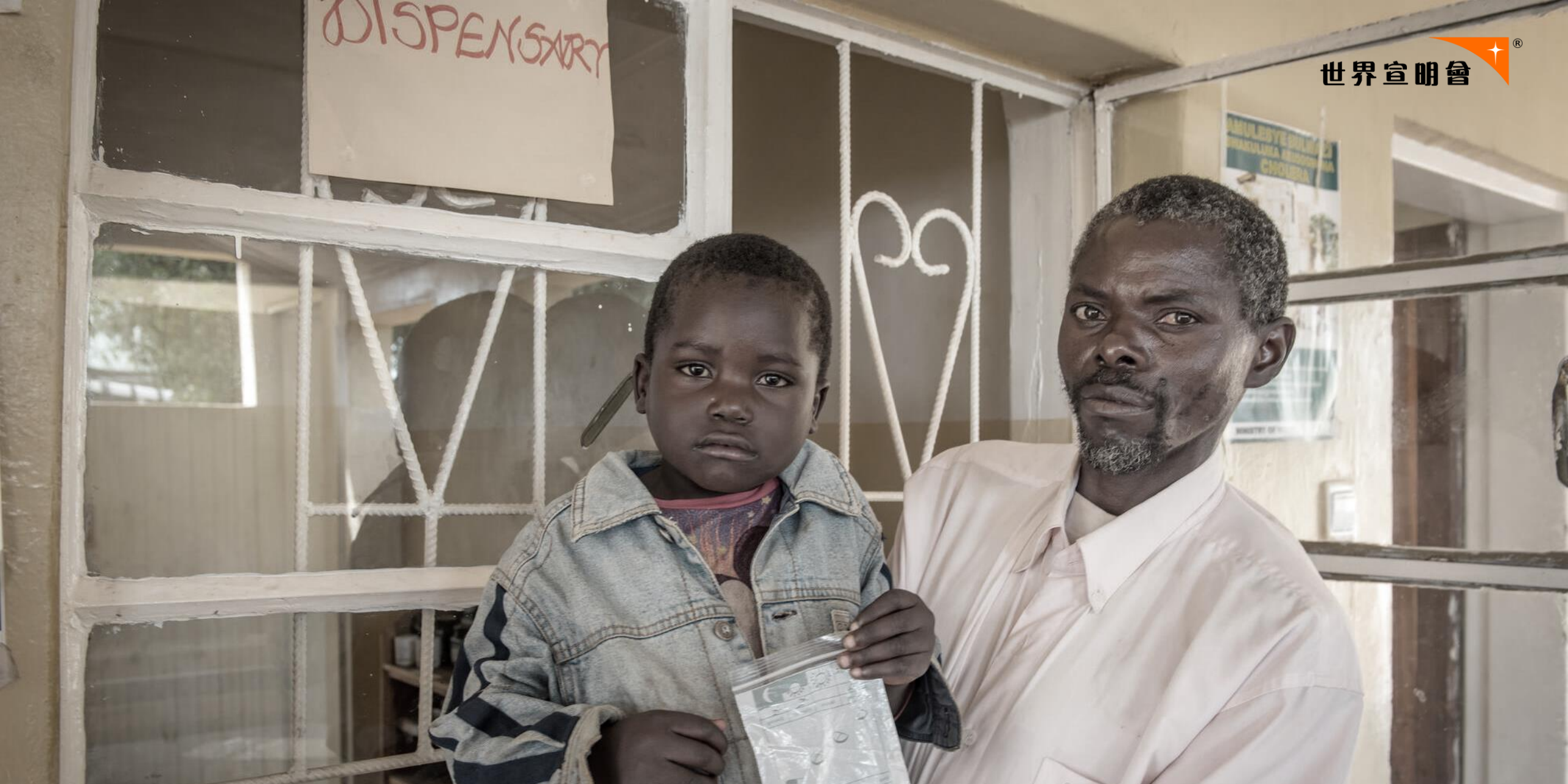
德比的第四個好朋友是這位阿當弟弟。他之前生病，大家也很擔心他。 阿當弟弟去了宣明會興建的診所看病，拿了藥物。