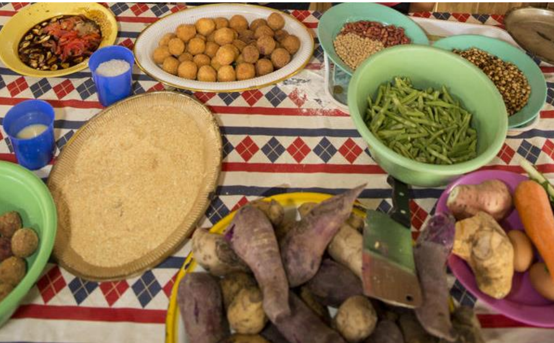
各種營養食物對小朋友都十分重要，小朋友要學習均衡飲食。