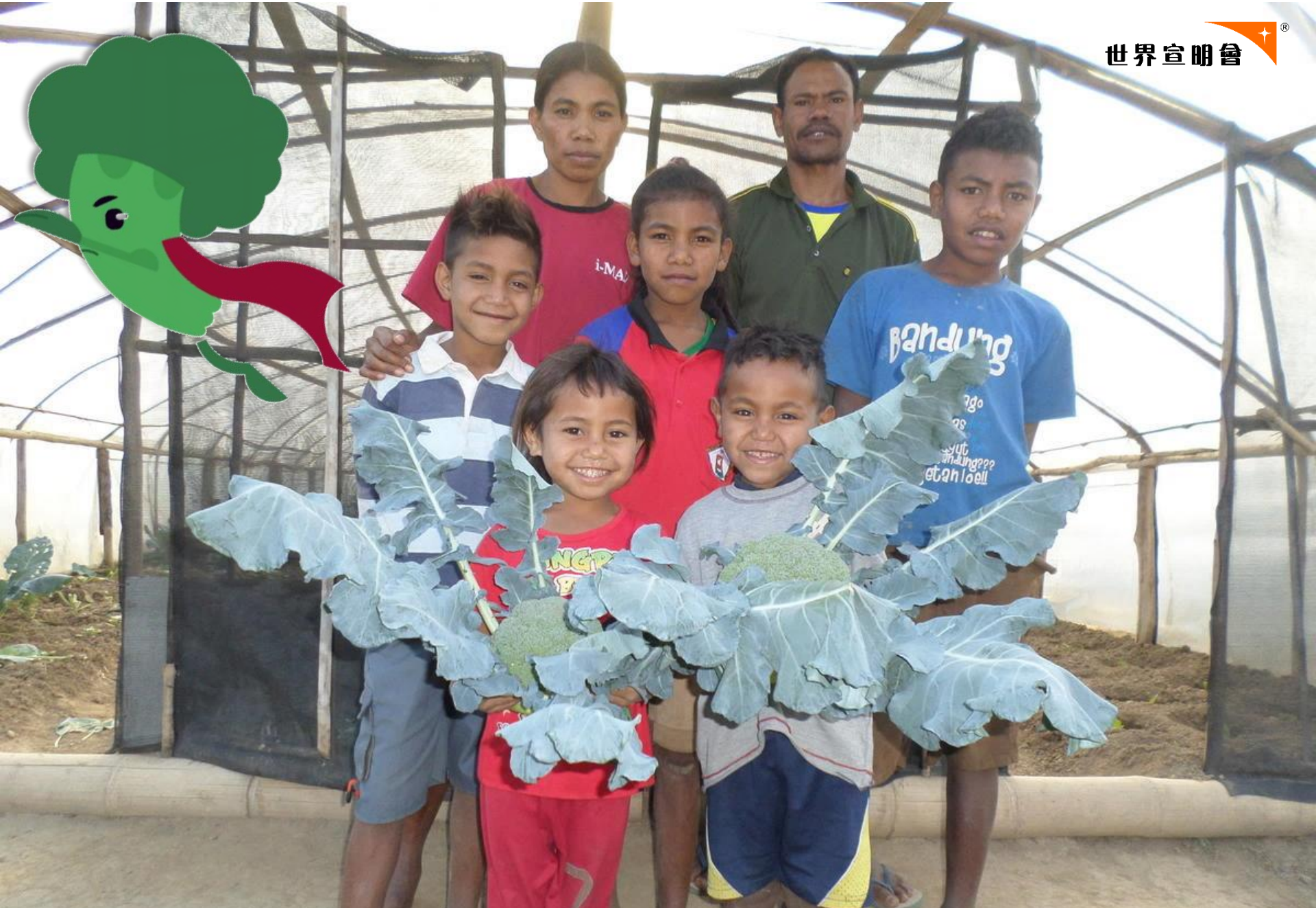
西蘭花更為貧困家庭帶來食物和希望，像超人般帶來幫助。