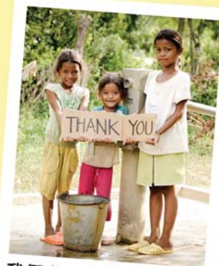
我們非常感謝宣明會為我們村莊興建水井！